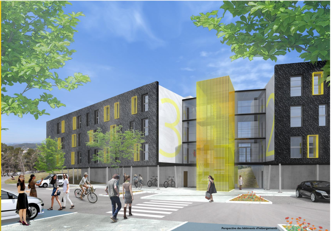
Perspective des bâtiments d'hébergements