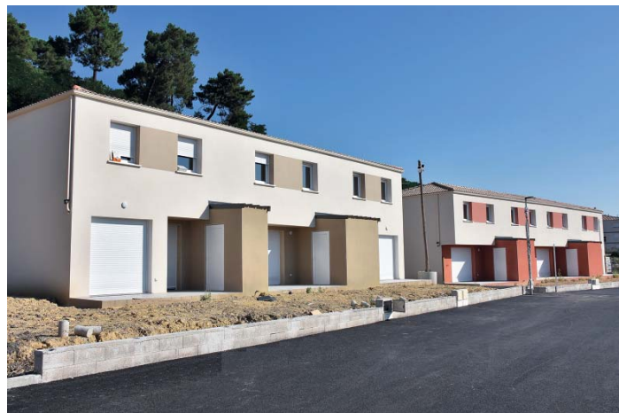
Les Jardins des Camélias est un nouvel ensemble composé de 44 villas, à Rochebelle (Alès).

Enfin, pour conclure cette longue liste de mise en service, il y aura en novembre deux dernières opérations : à Bagnols-sur-Cèze et à Sernhac, ce sont respectivement 45 appartements (14 T2, 22 T3 et 9 T4) et 16 villas (T4) qui seront proposés à la location.