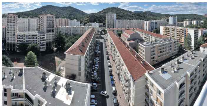
L'opération débutera par les logements du centre-ville d'Alès.

Ce projet vient en complément des travaux d'aménagements que Logis Cévenols engage au coup par coup (remplacement de la baignoire par une douche le plus souvent) dans les logements où cela devient indispensable pour le locataire.