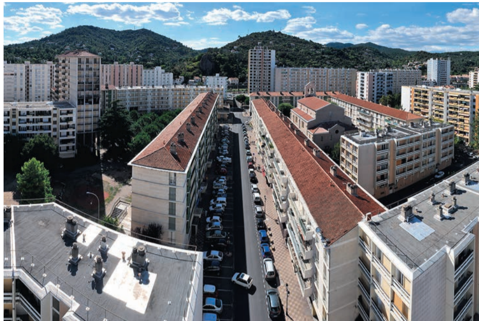
Afin de répondre aux exigences de la nouvelle loi ÉLAN, Logis Cévenols a ouvert un partenariat gagnant-gagnant avec 3F Occitanie.