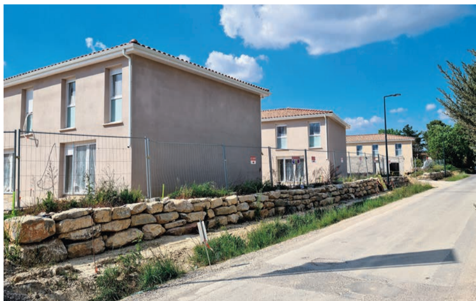
À Saint-Christol-lez-Alès, l'opération concerne 49 logements individuels qui seront prêts à l'automne.

• À Saint-Martin-de-Valgalgues , le projet "Le Moulin", situé au chemin du Moulin, comprend 66 logements dis-