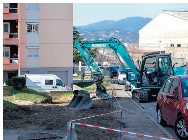
Avec les chantiers réalisés sur son patrimoine, Logis Cévenols injecte 53 M€ par an dans l'économie locale.