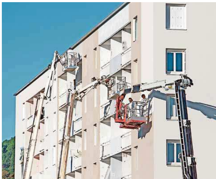
Fidèle à sa politique, Logis Cévenols maintient un haut niveau d'exigence en matière d'entretien de son patrimoine.

Ainsi, malgré les contraintes financières sup-