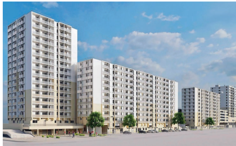
Les logements appartenant à Logis Cévenols seront, comme promis, rénovés dans le cadre du NPNRU qui transforme actuellement la Grand'rue Jean Moulin.

Les travaux touchant les parties communes concernent donc en premier lieu l'isolation et l'embellissement des façades, sur le modèle de ce qui a été déjà réalisé à la résidence "Le Villeneuve", tout à l'autre bout de la rue. Les installations électriques des parties communes, la rénovation des boiseries des halls et le changement des portes d'entrée des immeubles, le rééquilibrage et le calorifugeage des réseaux de chauffage font aussi partie des interventions prévues.